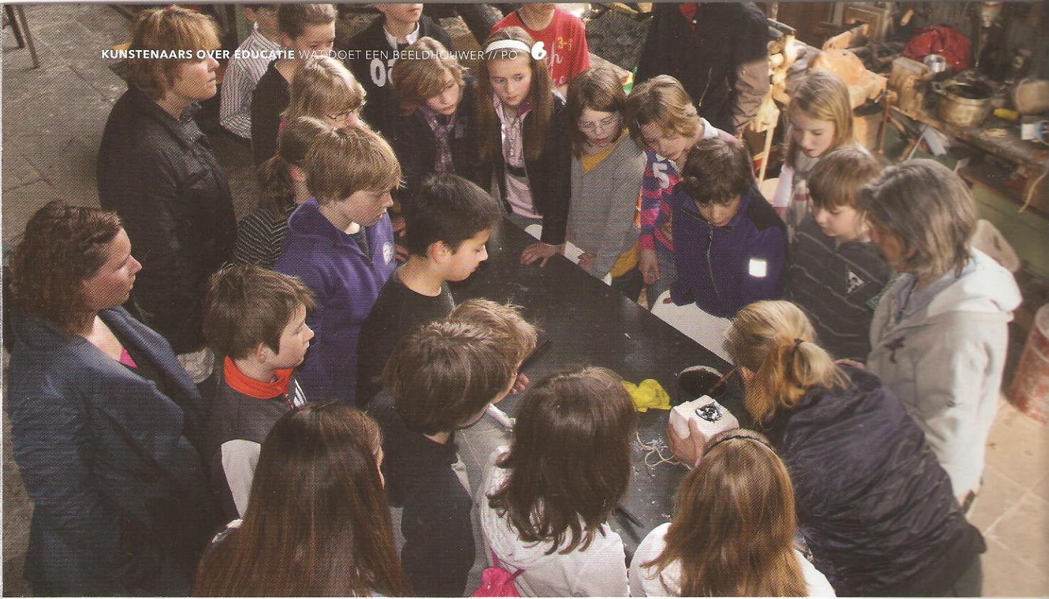
Leerlingen van Basisschool De Dorendal uit Doorwerth bij een demonstratie in het atelier.